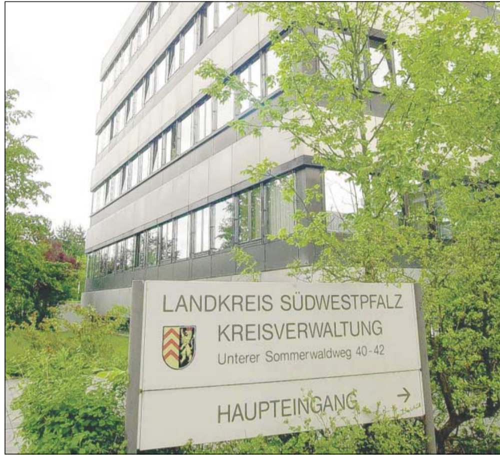
Ob Verwaltungsstruktur, Aufgabenzuständigkeit oder Größenordnung von Gebietskörperschaften: In Rheinland-Pfalz soll in den nächsten Jahren alles auf den Prüfstand.