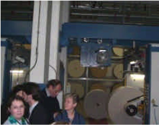
Eindrücke aus der Zeitungsdruckerei Media Print (Kronenzeitung )